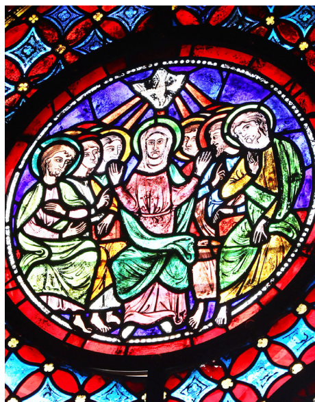
Vitrail de la Pentecôte, Chapelle des anges de la cathédrale Saint-Julien du Mans