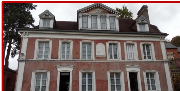
Maison familiale de Ste Thérèse aux Buissonnets