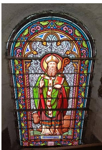
Temps de prière pour St Saturnin