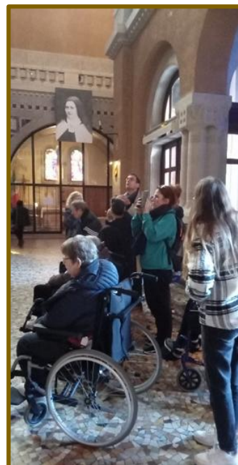
Les résidents de l'EHPAD attentifs à la visite