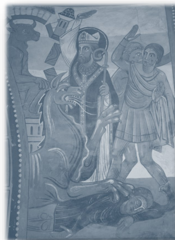
Photo 1 : Julien et le miracle de la fontaine, fresque de Ponce-sur-Loir

Aujourd'hui, deux villages du sud de l'Italie et de la Sicile sont sous la protection de Saint-Julien du Mans. Il est fêté le 27 janvier.