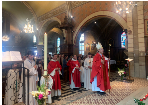
La liturgie, lieu privilégié de la communion de l'Église

Il en tire l'idée que « nous avons besoin d'une formation liturgique sérieuse et vitale » (n°31) et il offre ainsi des pistes pour réguler la vie liturgique qui ne s'appuient pas, comme certains auraient pu le souhaiter, sur un renforcement de l'appareil disciplinaire et la mise en avant du respect des prescriptions, mais sur une formation approfondie reposant sur une intelligence de l'action. Accueillons cette Lettre comme un document majeur et même un texte de référence pour la formation liturgique de l'ensemble des chrétiens.