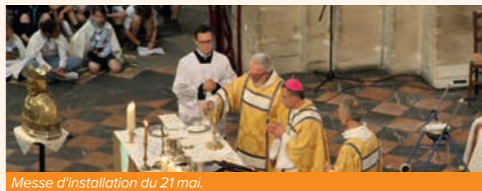
Messe d'installation du 21 mai.

Ces différents rites et la présence de plusieurs évêques et de l'administrateur diocésain de Paderborn témoignent de la collégialité épiscopale et nous rappelle que la charge d'évêque se vit dans une véritable communion ecclésiale, parce que l'Église est un seul peuple de Dieu, un seul corps du Christ et un seul temple de l'Esprit.