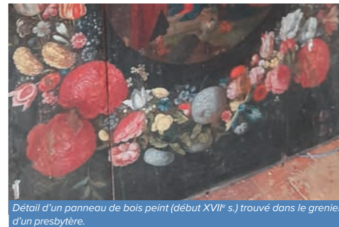
Détail d'un panneau de bois peint (début XVII e s.) trouvé dans le grenier d'un presbytère.

Début 2023, une dizaine de clochers de la Sarthe se sont lancés dans cette aventure pour recenser chaque objet ou mobilier, qu'il soit utilisé ou bien caché, dans une sacristie ou le grenier d'un presbytère.