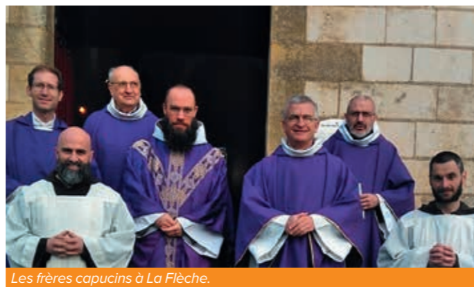
Les frères capucins à La Flèche.

Quatre capucins sont venus sillonner les bords du Loir du 25 mars au 2 avril 2023. Ces frères de saint François d'Assise ont débuté leur séjour par une marche avec des paroissiens de Clermont-Créans jusqu'à La Flèche puis les activités se sont succédé dans les communes, les églises, le marché, les écoles catholiques, le Prytanée et même le théâtre de la Halle au Blé. Dans ce lieu prestigieux, ils ont engagé une réflexion sur la « sobriété heureuse » avec un chef d'entreprise et la maire de la ville.