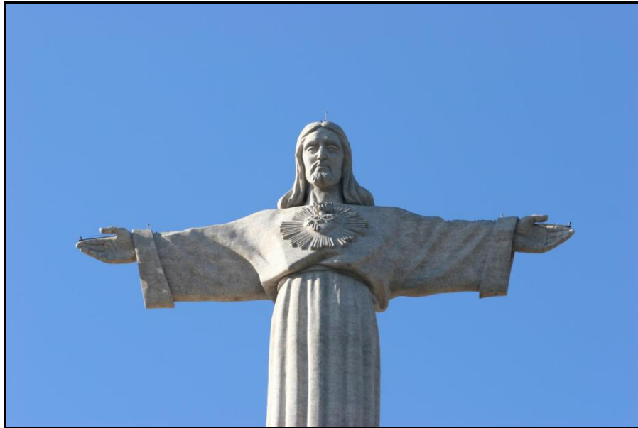
Christ Roi de Lisbonne

Jésus parlait à ses disciples de sa venue : « Quand le Fils de l'homme viendra dans sa gloire, et tous les anges avec lui, alors il siégera sur son trône de gloire. Toutes les nations seront rassemblées devant lui ; il séparera les uns des autres, comme le berger sépare les brebis des chèvres : il placera les brebis à sa droite, et les chèvres à sa gauche.