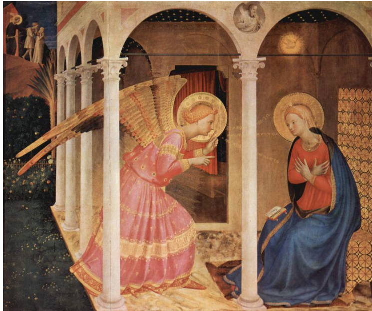
Annonciation Fra Angelico 1438